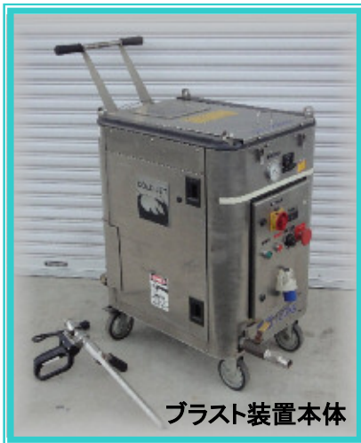
ブラスト装置本体